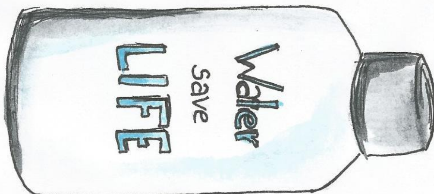
Mehrweggeschirr die Zukunft :-)

Bei Veranstaltungen verwenden wir nach Möglichkeit kein Einweggeschirr und keine Einwegflaschen.